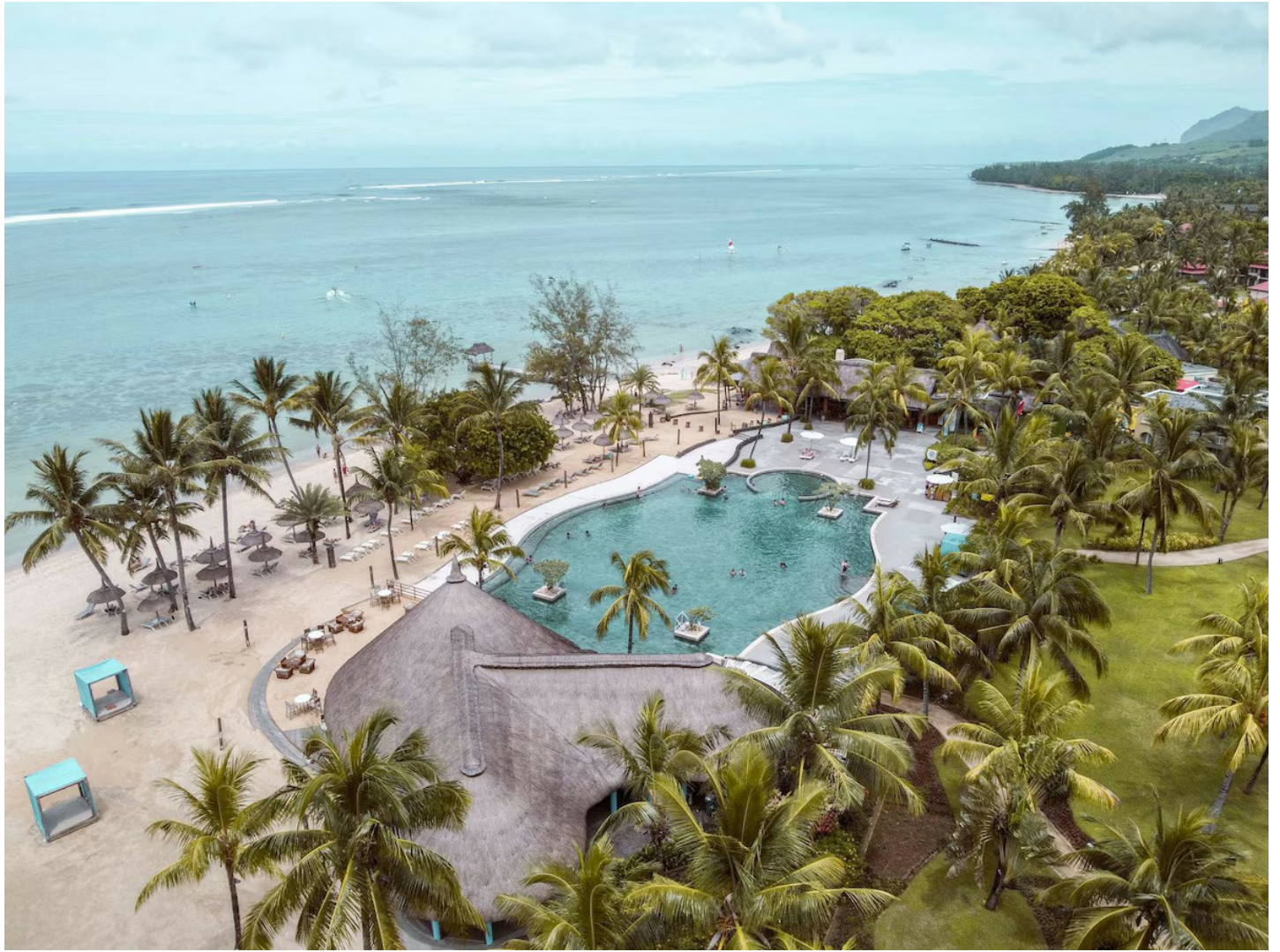
Bel Ombre (Südküste)

Das charmante Bijou-Hotel mit entspannter Atmosphäre strahlt Wohlfühlambiente aus und lässt Sie den Alltag im Nu vergessen.