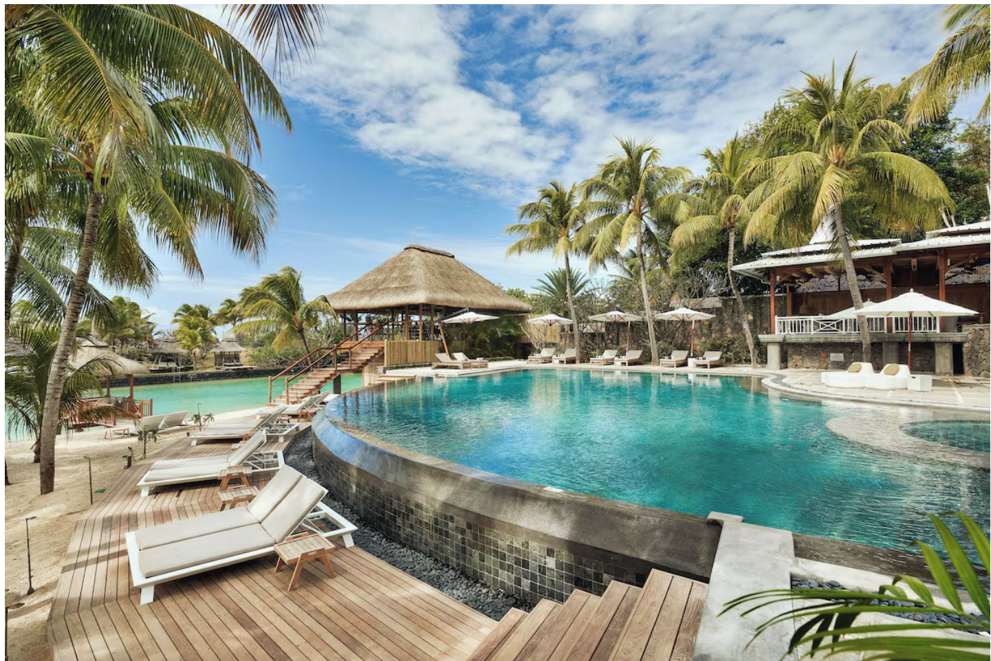
Anse la Raie (Nordküste)

Dieses romantische Boutiquehotel befindet sich in exklusiver Lage und bietet Charme und Privatsphäre.