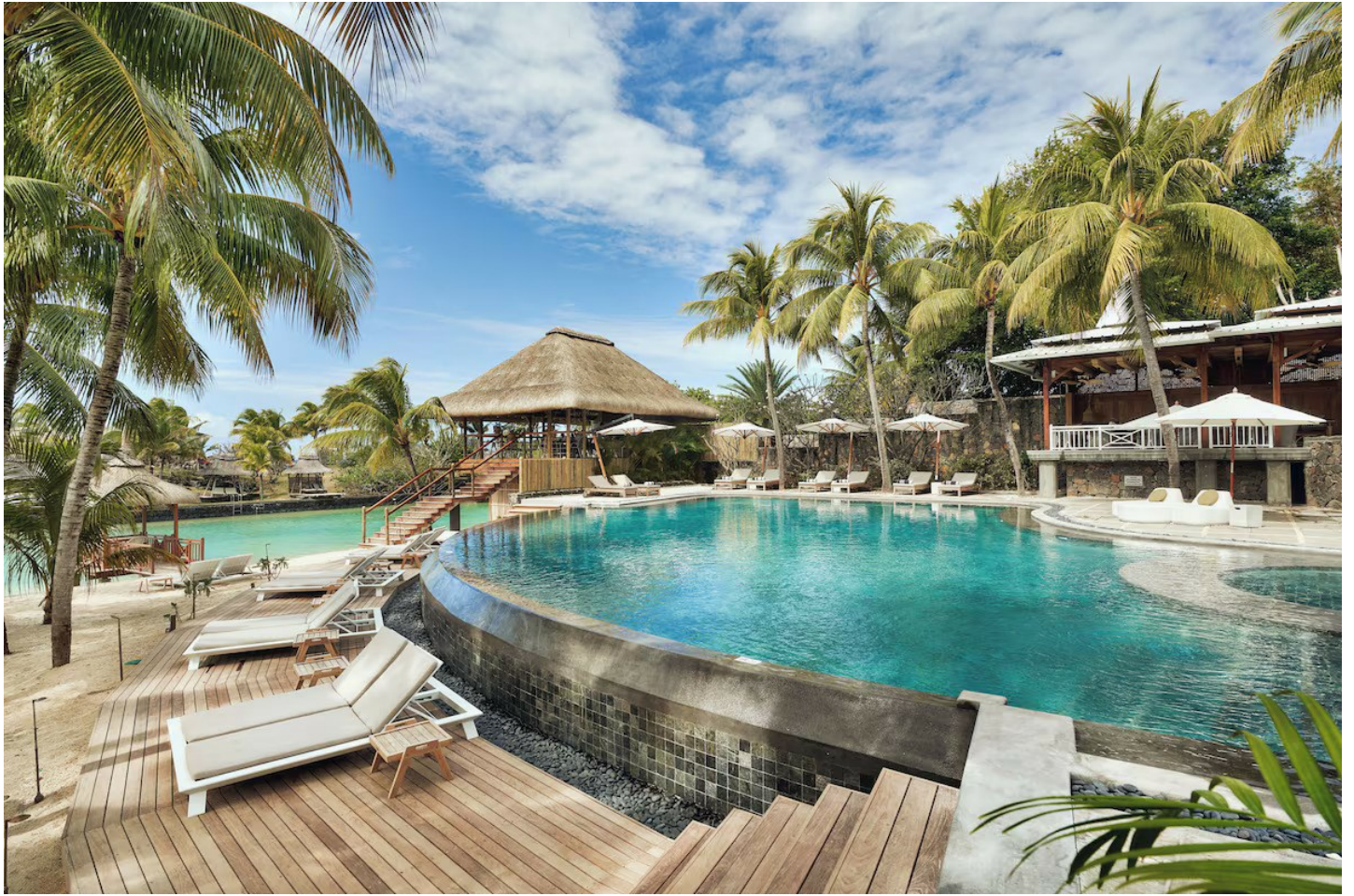
Anse la Raie (Nordküste)

Dieses romantische Boutiquehotel befindet sich in exklusiver Lage und bietet Charme und Privatsphäre.