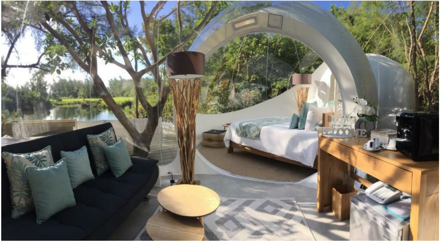
Bois Chéri & Île aux Cerfs

Entdecken Sie Mauritius aus einer neuen Perspektive in der Bubble Lodge.