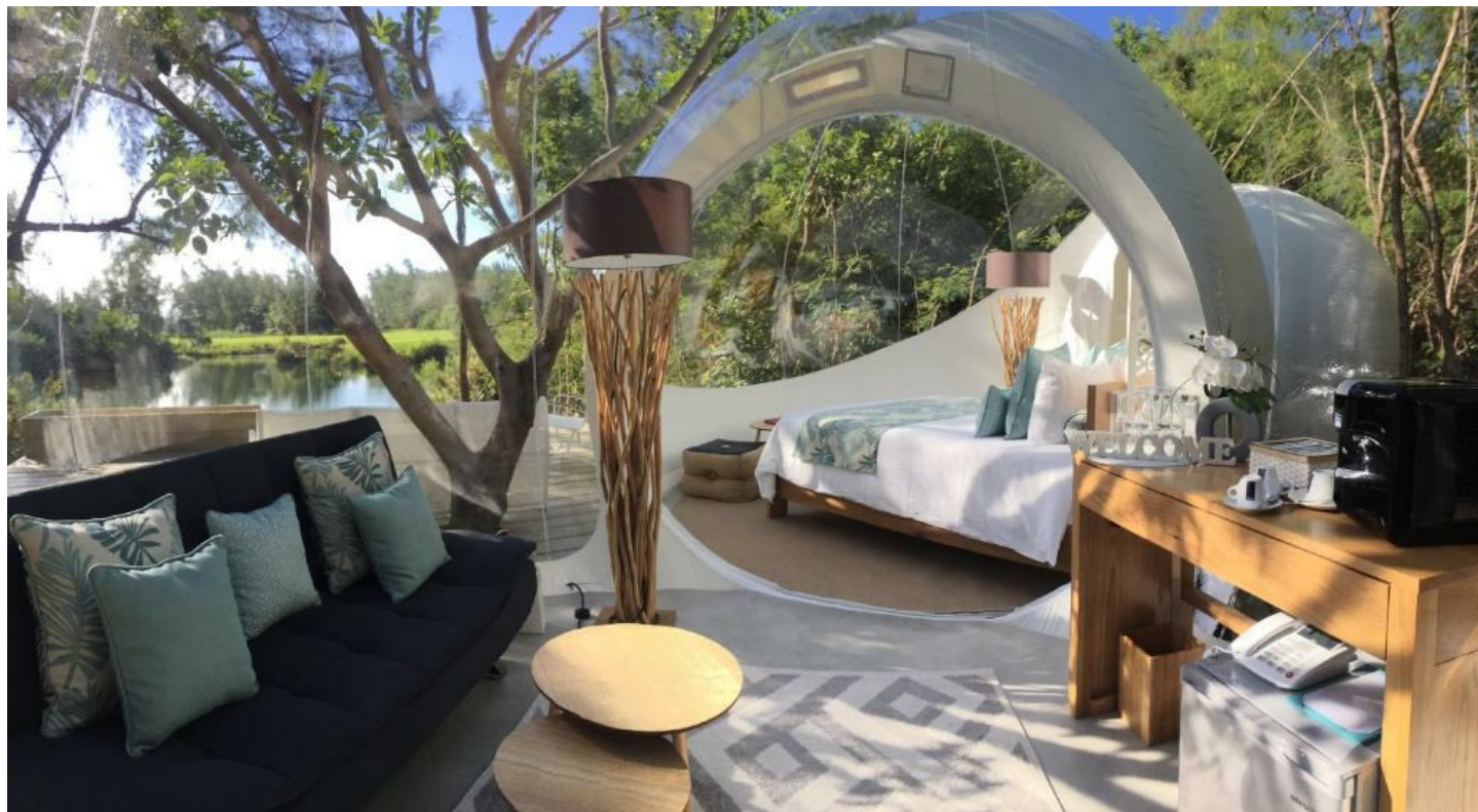
Bois Chéri & Île aux Cerfs

Entdecken Sie Mauritius aus einer neuen Perspektive in der Bubble Lodge.