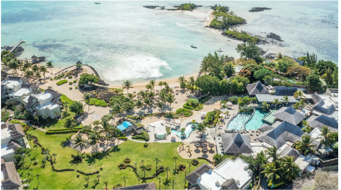
Grand Gaube (Nordküste)

Ein Hotel mit viel Charme und Barfuss-Feeling, das mit typisch mauritischem Konzept überzeugt.