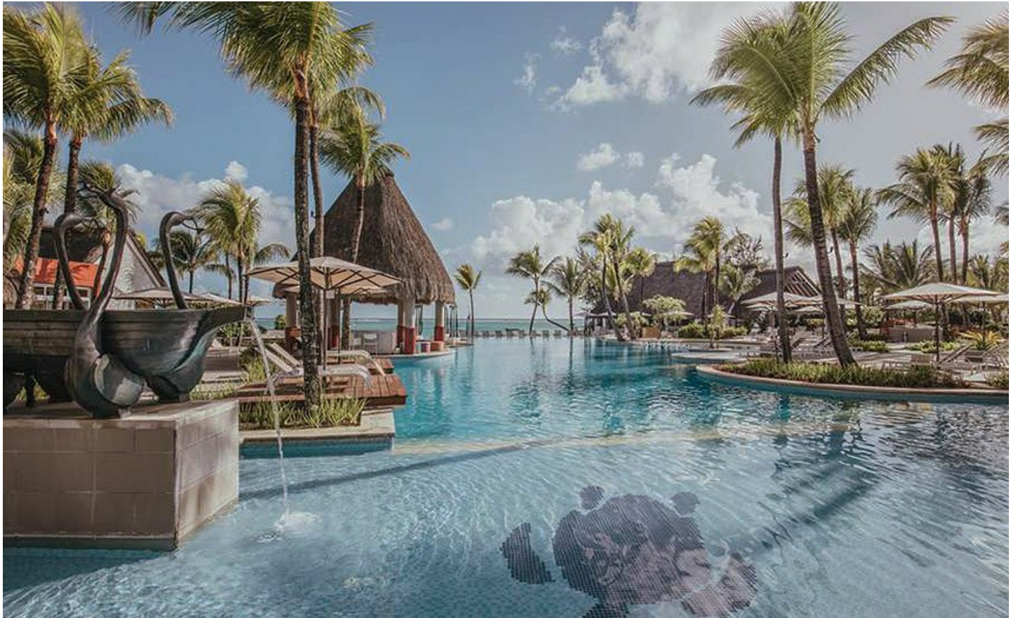
Belle Mare (Ostküste)

Direkt am wunderschönen Strand von Belle Mare gelegenes Strandresort nur für Erwachsene mit einem All-inclusive Angebot.