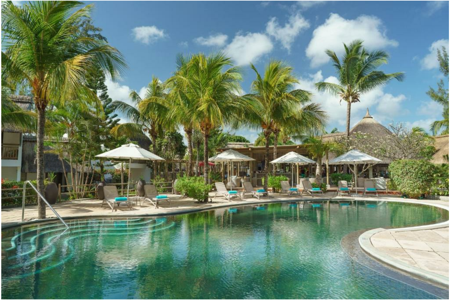
Bain Boeuf (Nordküste)

Dieses kleine Hotel besticht durch seine schöne Lage im Norden von Mauritius mit Sicht auf den Coin de Mire.