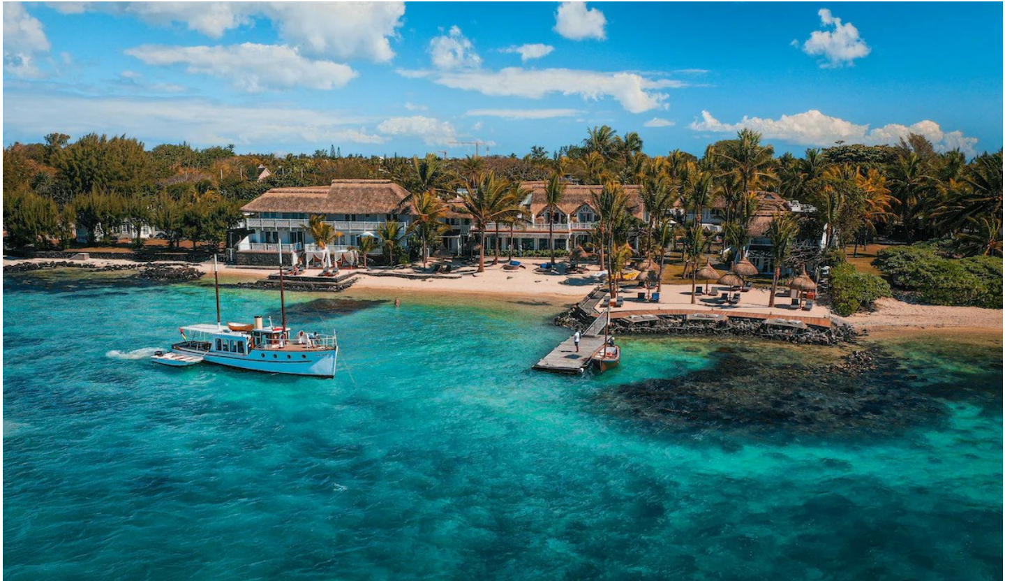
Grand Baie (Nordküste)

Kleines und feines Boutiquehotel mit persönlicher Atmosphäre und wunderschöner Aussicht auf die türkisblaue Lagune.