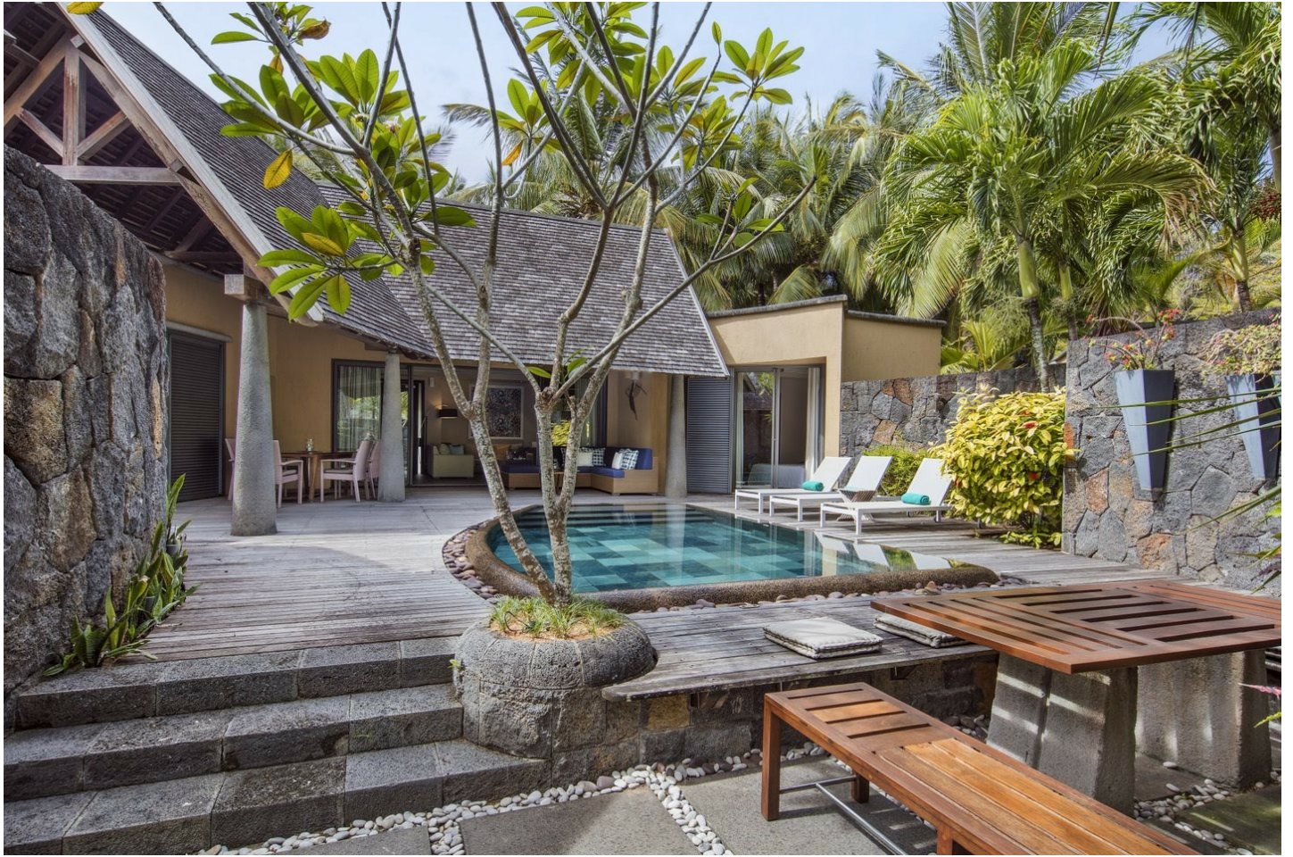
Trou aux Biches

Das beliebte Luxushotel liegt an einem der schönsten Strände der Insel und punktet mit tropischer Eleganz, Komfort und Privatsphäre.