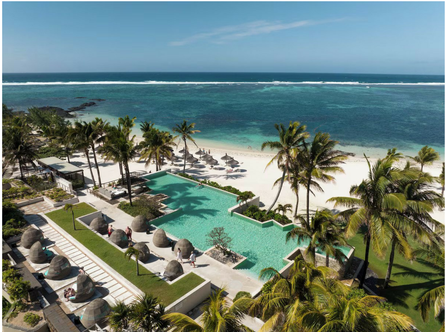
Belle Mare (Ostküste)

Dieses Resort überzeugt mit moderner Architektur - im Herzstück der Anlage befindet sich eine schöne Auswahl an Restaurants, Bars und Boutiquen.