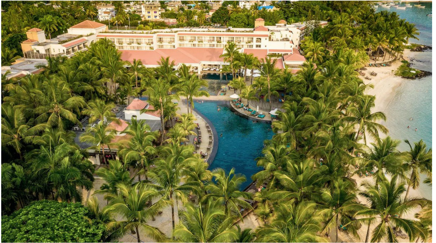
Grand Baie (Nordküste)

Der ideale Urlaubsort für unternehmungslustige Feriengäste. Das einzige Hotel dieser Kategorie im Zentrum von Grand Baie bietet eine unbeschwernte Ferienstimmung.