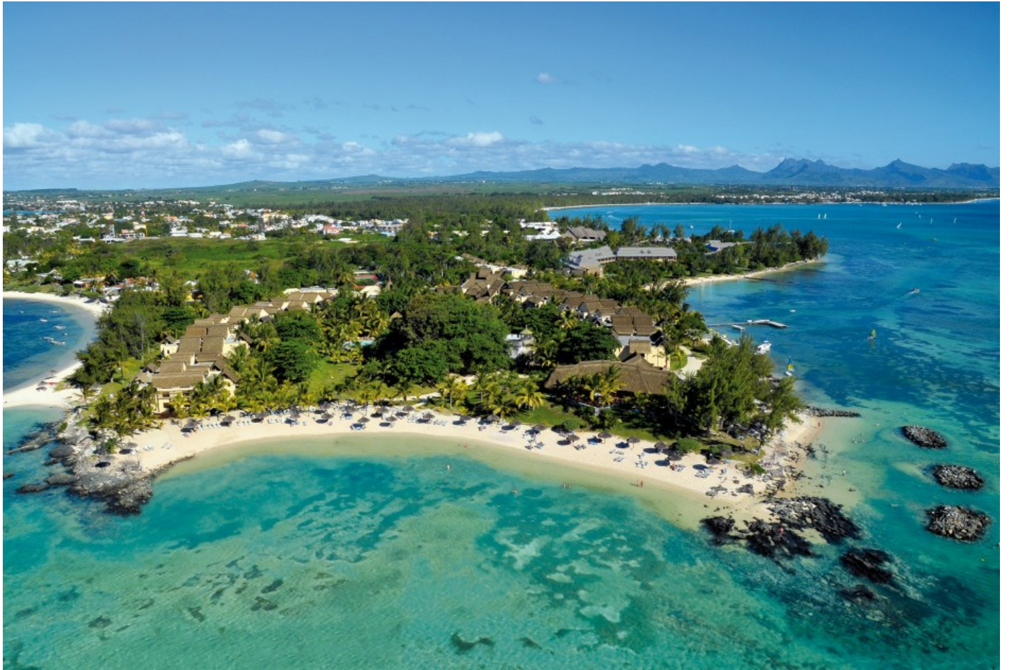
Pointe aux Canoniers (Nordküste)

Das familienfreundliche Hotel liegt auf einer Halbinsel in einem tropischen Garten und begeistert mit seiner Lage und Atmosphäre.