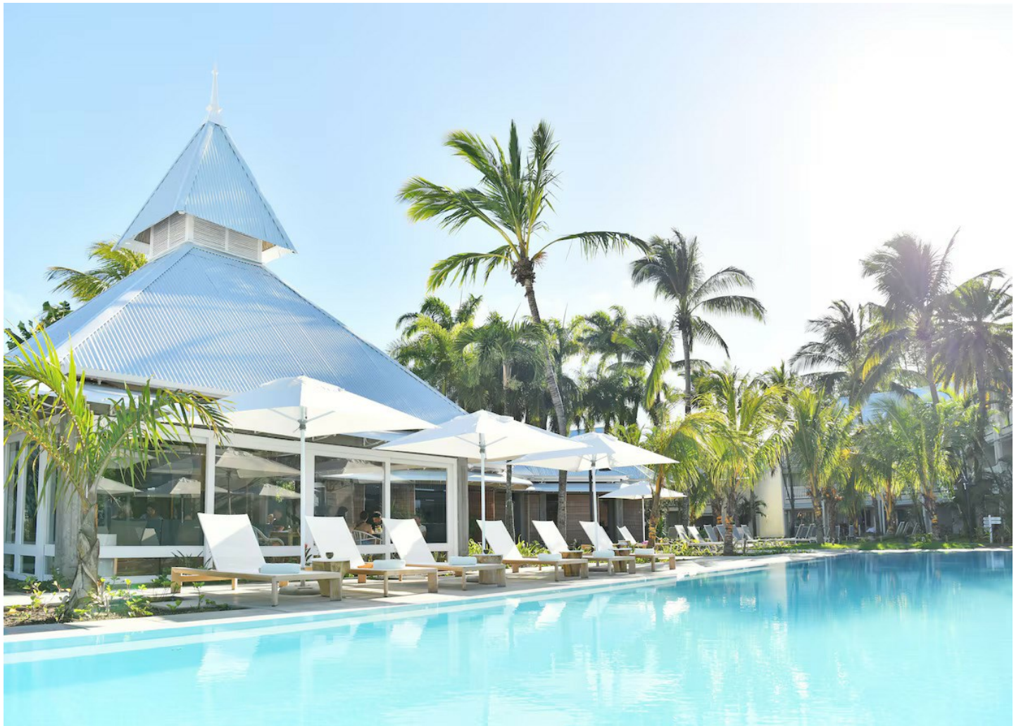
Grand Baie (Nordküste)

Eine Kombination aus leichtem kreolischem Flair, grosser Gastfreundschaft und gemütlich gestalteten Unterkünften garantiert gelungene Ferien auf Mauritius.