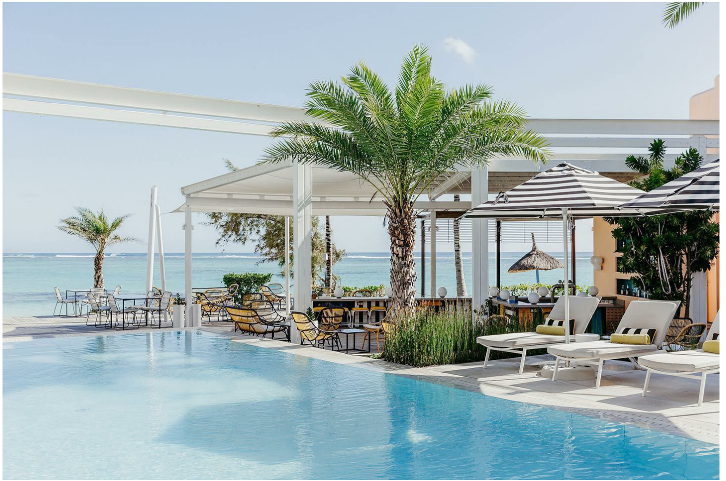
Belle Mare (Ostküste)

Boutiquehotel für Erwachsene mit einzigartig nachhaltigem Hotelkonzept.