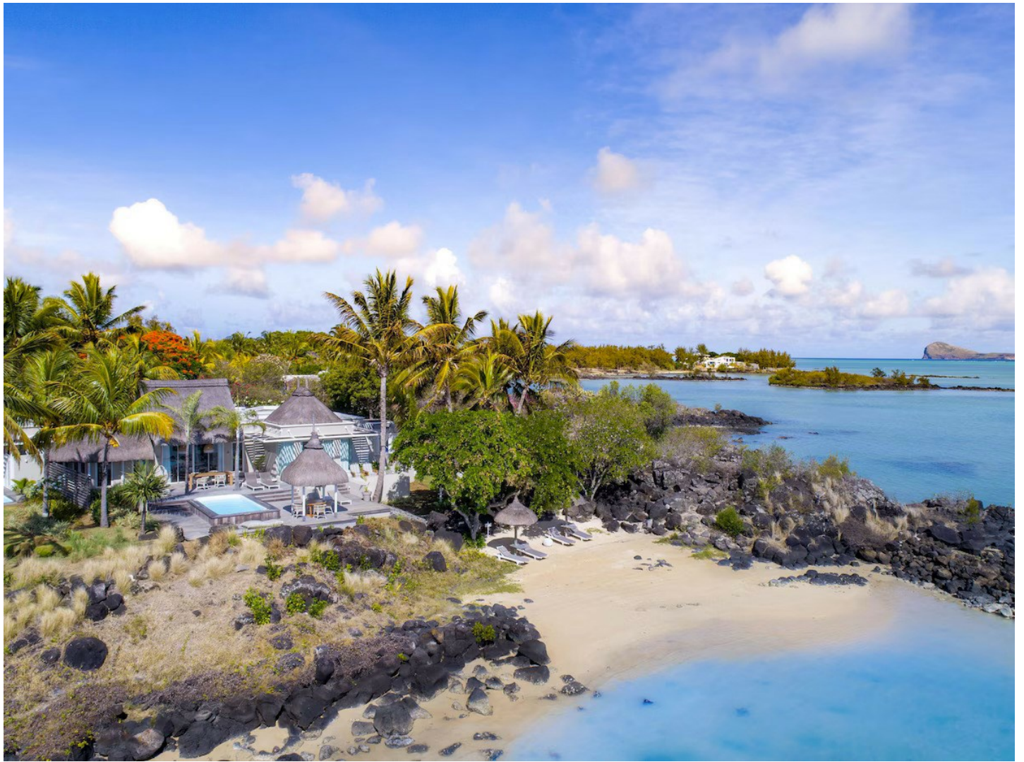
Grand Gaube (Nordküste)

Im Herzen eines tropischen Gartens liegt das Luxusresort LUX* Grand Gaube an 2 natürlichen Strandbuchten und am türkisfarbenen Ozean.