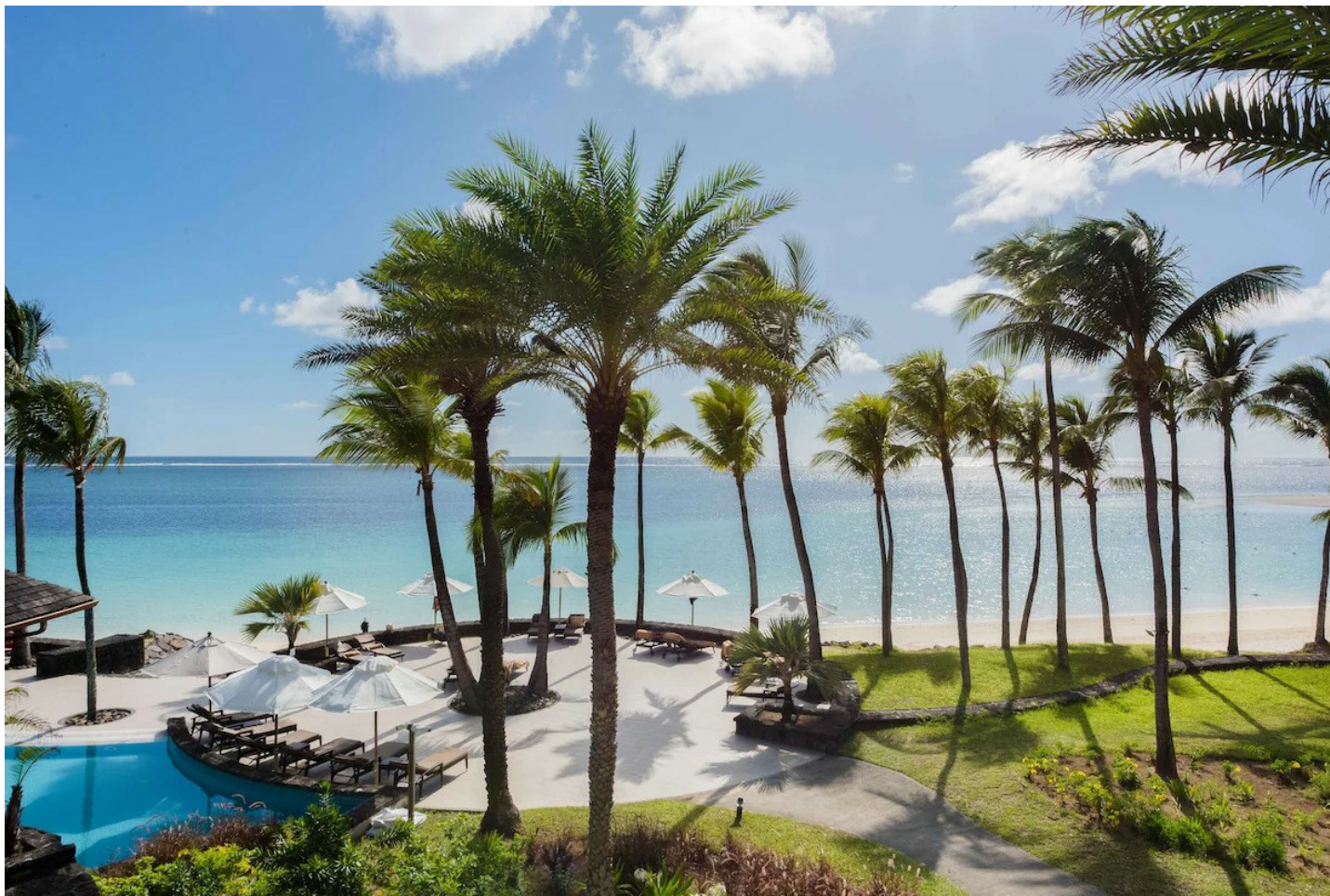
Belle Mare (Ostküste)

Ein aussergewöhnliches Luxushotel im Kolonialstil, welches mit Topservice und traumhaftem Ambiente höchsten Ansprüchen gerecht wird.