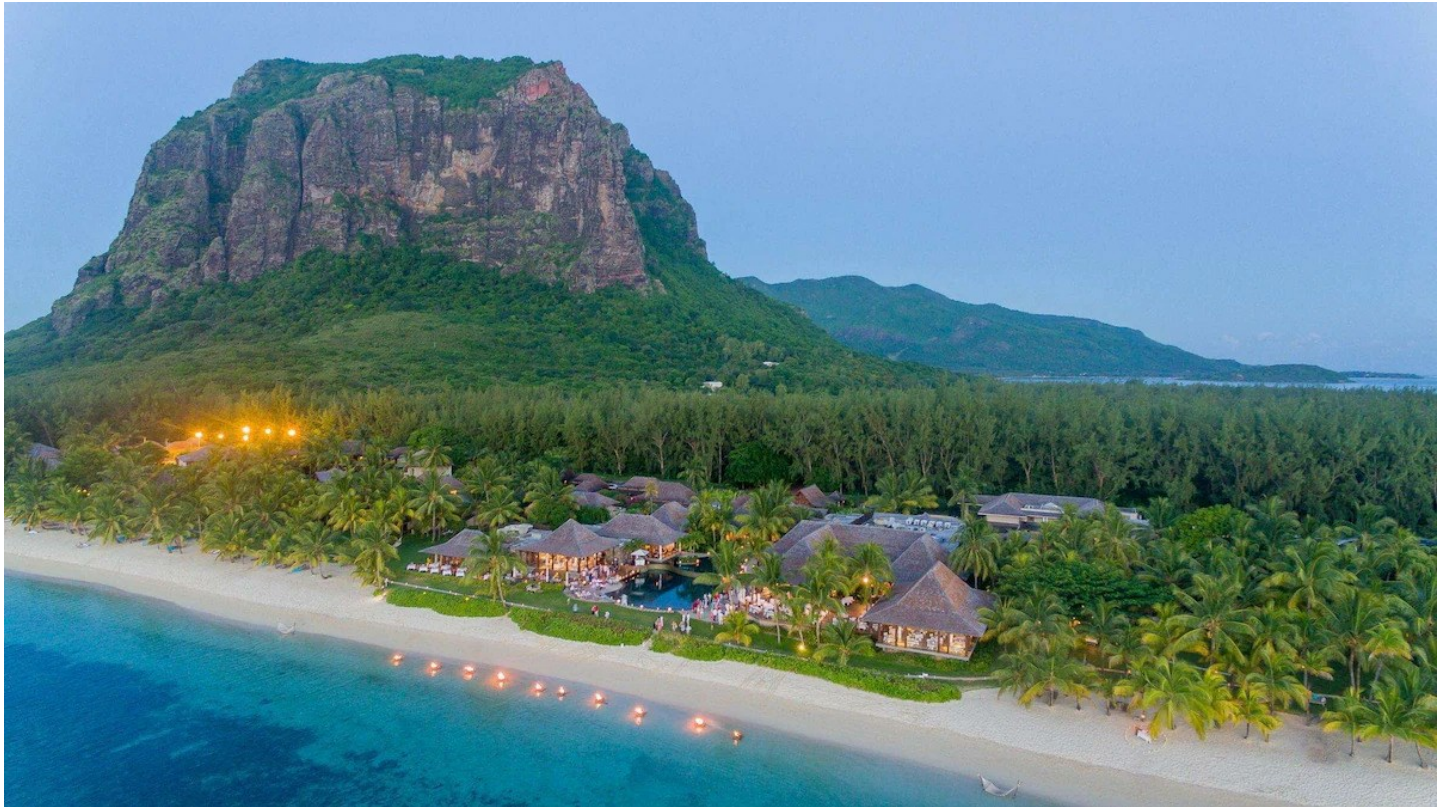
Le Morne (Südküste)

Die einzigartige Lage sowie die idyllische Architektur im Villenstil und der authentische und mondäne Stil, machen dieses charmante Hotel zu einem beliebten Feriendomizil.