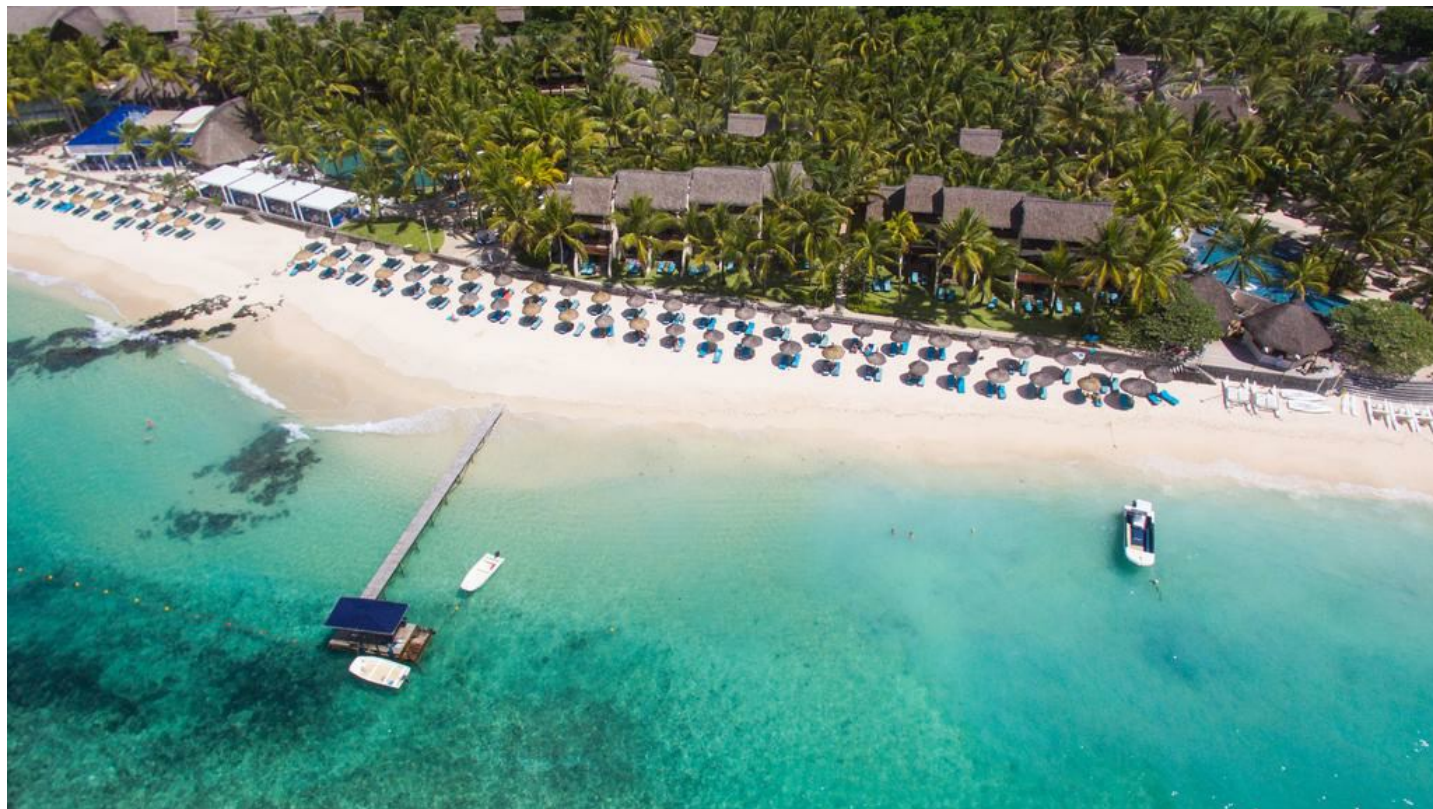
Poste de Flacq (Ostküste)

Elegantes Erstklasshotel unter Deutsch sprechender Leitung mit grossem Freizeitangebot und angenehmer, ungezwungener Atmosphäre.