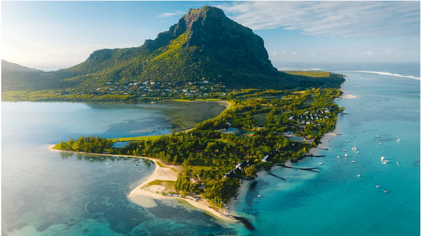
Le Morne (Südküste)

Das traumhafte Ferienparadies bietet elegante, aber dennoch lockere Atmosphäre und wird von aktiven Gästen und Strandbegeisterten gleichermaßen geschätzt.