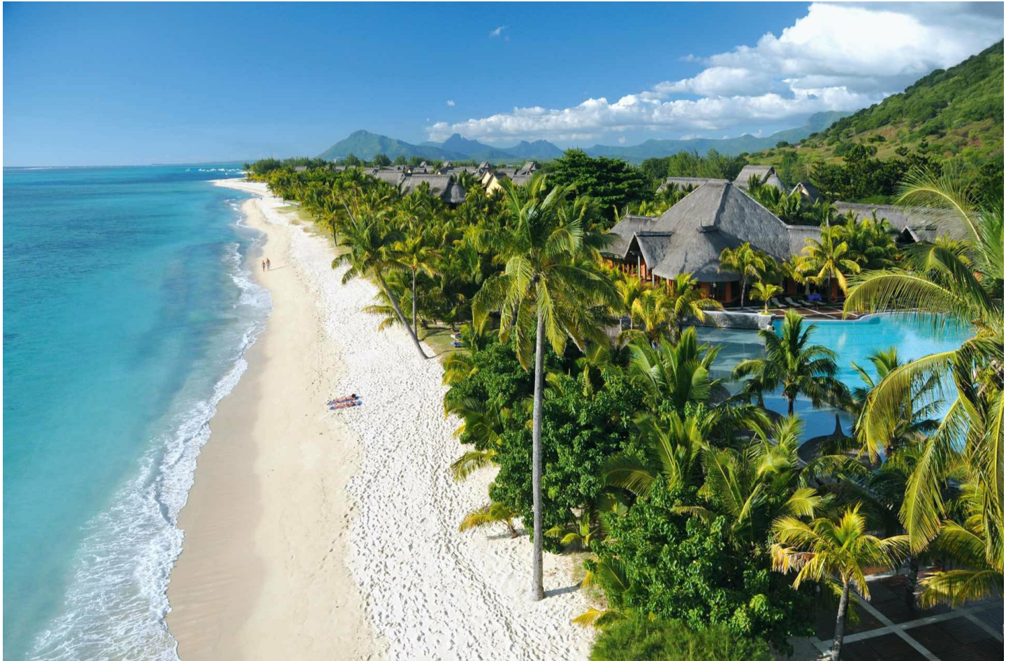
Le Morne (Südküste)

Ein Luxushotel der aussergewöhnlichen Art für höchste Ansprüche - Harmonie, Entspannung und Wellness werden besonders gross geschrieben.