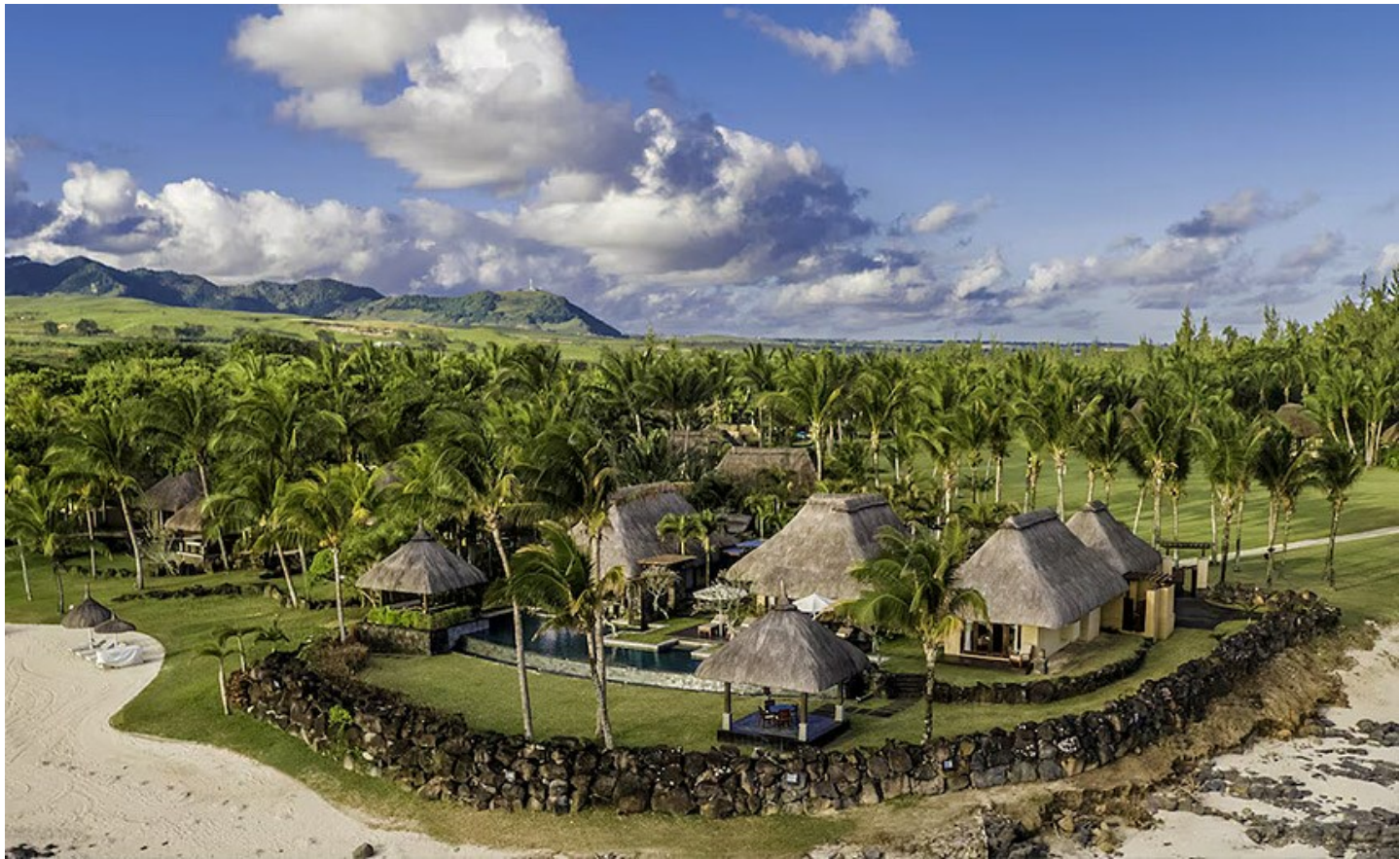
St. Félix (Südküste)

Das Luxury Boutique Lifestyle Beach Resort ist ein kleines Paradies für Körper und Seele.