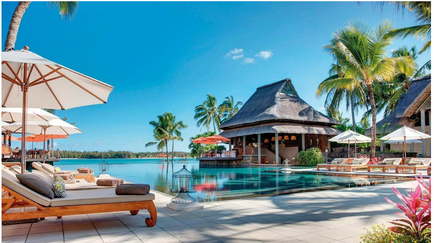
Poste de Flacq (Ostküste)

Zu Recht gehört das Constance Prince Maurice zu den The Leading Hotels Of The World. Das kleine und feine Luxusresort lässt keinen Wunsch offen.