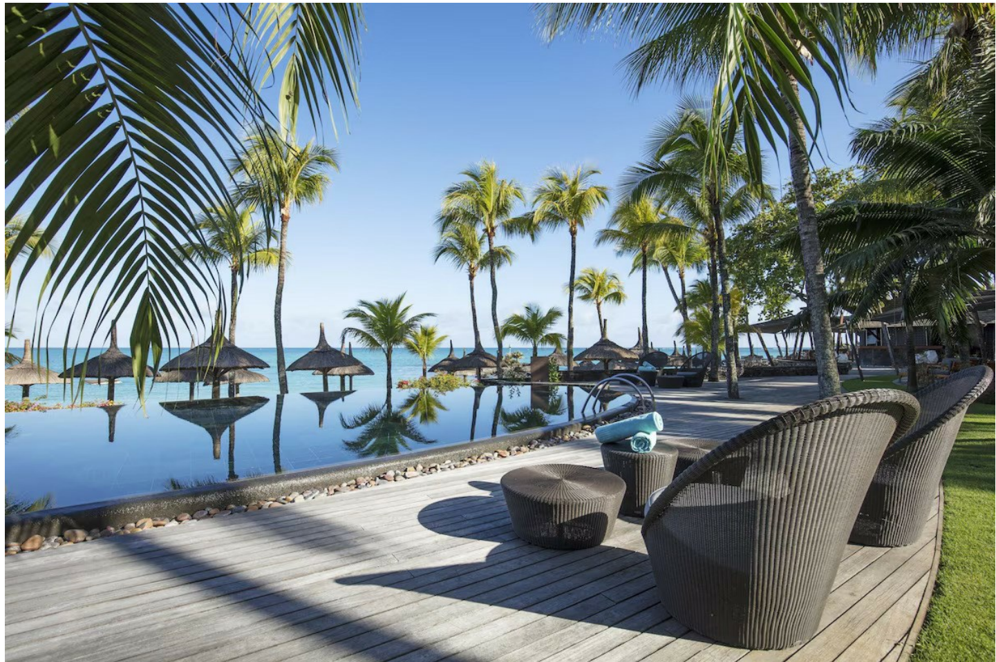
Grand Baie (Nordküste)

Dieses exklusive Hideaway mit gepflegter Atmosphäre erfüllt jeden Ferienwunsch und lässt Ihren Aufenthalt unvergesslich werden.