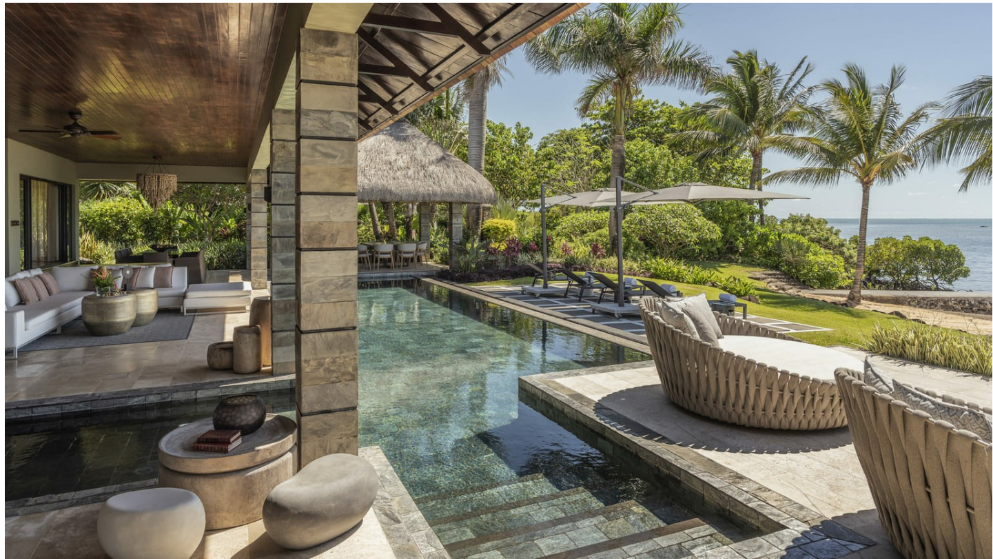
Beau Champ (Ostküste)

Vor allem Gäste mit gehobenen Ansprüchen, Feinschmecker und Golfer kommen in dieser weitläufigen, luxuriösen Anlage auf ihre Kosten: ein exklusives Ferienparadies.