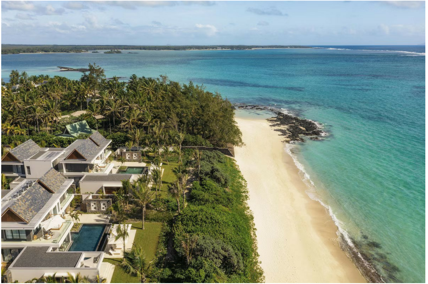
Poste de Flacq (Ostküste)

Das One&Only Le Saint Gérain bietet somit eine perfekte Kombination aus Luxus, Komfort und vielfältigen Aktivitäten für einen unvergesslichen Aufenthalt auf Mauritius.